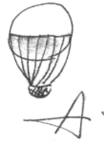
Andrea De Carlo